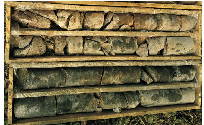
Abb. 2 Exemplarischer Bohrkern

Durch die Erkundungen wurde das zu durchbohrende Gneisgestein aufgeschlossen (siehe Abb. 2). In den Bohrlochern wurden Kamerabefahrungen und Bohrlochscans ausgeführt (siehe Abb. 3), um eine bestmögliche Erfassung des Trennflächensystems zu ermöglichen.